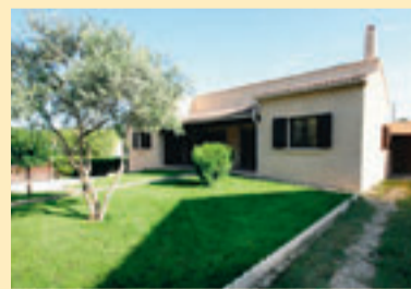
ST-PAUL TROIS CHATEAUX 900 KM VAN BRUSSEL

Villa in Provençaalse stijl in de Drôme op wandelafstand van het dorpscentrum. Je komt meteen binnen in de woonkamer met een haard en open keuken. Er zijn twee slaapkamers met ingebouwde kasten. De garage kan gemakkelijk omgebouwd worden tot een extra slaapkamer en eventueel een tweede badkamer. Het zuidgerichte terras is overdekt. Het perceel van 720 m 2 , met veel bomen, is omheind. (BCW) Meer info: www.yprimmo.be en 057/21 24 65