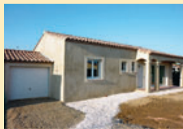
LEZIGNAN 1.109 KM VAN BRUSSEL

Nieuwbouwbungalow op een omheind stuk grond van 541 m 2 , op een wooncomplex in de Aude. Mooi ingericht met ruime open keuken en woonkamer van 46 m 2 . Er zijn drie slaapkamers en een smalle badkamer met ligbad en dubbele lavabo. De tuin en de omgevingsaanleg moeten nog gebeuren. Er is ook ruimte voor een zwembad. Gelegen aan de rand van een wijnbouwersdorp. Meer info: www.audevie.com en 0033/468 90 65 18 (Nederlandstalig)