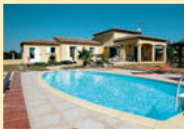
LEMUY 1.122 KM VAN BRUSSEL

Verzorgde villa uit 2004 op een afgesloten terrein van 1.356 m 2 . De bewoonbare oppervlakte bedraagt 140 m 2 . De living, eethoek en Amerikaanse keuken vormen één grote ruimte. Er zijn vier slaapkamers, waarvan één suite, en twee badkamers. Met airco. Overdekt terras met uitzicht op het zwembad dat enkele meters verder ligt. Residentiële omgeving. Meer info: www.cielbleu-invest.be en 0495/52 69 50