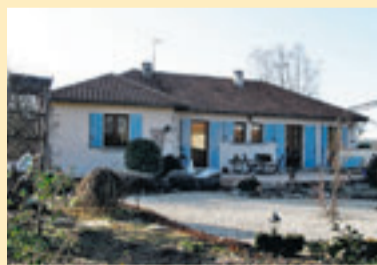
TOURTOIRAC 769 KM VAN BRUSSEL

WIJ GEVEN EEN KLEINE SELECTIE VAN HUIZEN DIE IN HET BUITENLAND TE KOOP ZIJN