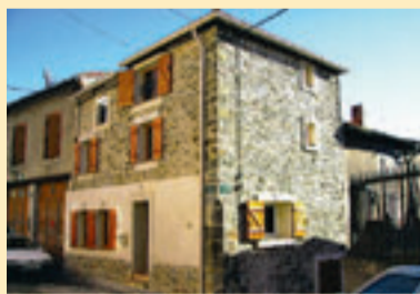
CORBIERES 1.034 KM VAN BRUSSEL

Smaakvol, karaktervol gerenoveerd dorpswoning uit 1900. Bewoonbare oppervlakte van 85 m 2 verspreid over drie verdiepingen. Op 20 minuten van Carcassonne en op 30 minuten van de kust. Terracotta vloeren en muren in oude steen. Grote keuken, maar kleine living. Er zijn drie slaapkamers en twee badkamers, een met bad en een met douche. Het dakterras biedt een prachtig uitzicht op de omgeving. Meer info: www.audevie.com en 0033/468 90 65 18 (Nederlandstalig)